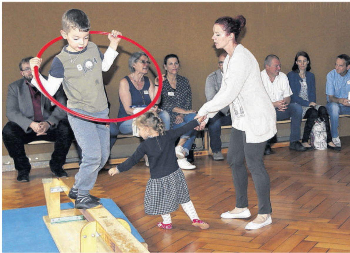
Die Grünen-Politikerin Brigitte Lösch (Bildmitte, hinten) schaut sich das Eltern-Kind-Turnen an, ein Angebot des Kinder- und Familienzentrums in der Kita Einsteinschule.

Bei den Kinder- und Familienzentren geht es darum - das wurde im anschließenden Gespräch deutlich - die Eltern der Kinder in der eigenen Einrichtung zu unterstützen und zu beraten. Darüber hinaus sind die Familienangebote auch Familien aus der Nachbarschaft, also im gesamten Quartier, zugänglich. (siehe In-